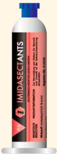
35 Gramm Kartusche Standard

für professionelle Anwender verpackt zu 6 Stück im Karton