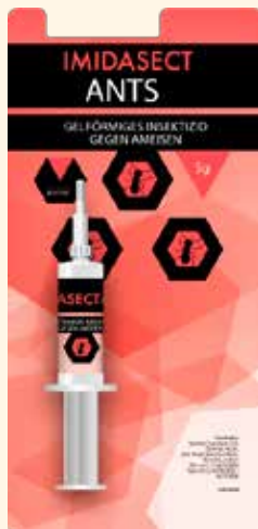
5 Gramm Spritze, verpackt im Blister

für professionelle Anwender verpackt zu 6 Stück im Karton