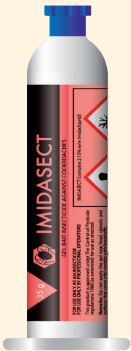
35 Gramm Kartusche Standard

Gefahrenhinweise: H411 – Giftig für Wasserorganismen mit langfristiger Wirkung. EUH208 Enthält 1,2-Benzisothiazol-3(2H)-on. Kann allergische Reaktionen hervorrufen. Sicherheitshinweise: P273 – Freisetzung in die Umwelt vermeiden. P391 – Verschüttete Mengen aufnehmen. P501 – Inhalt / Behälter gemäß den nationalen Vorschriften der Entsorgung zuführen.