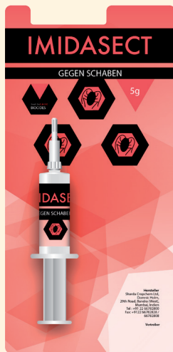
5 Gramm Spritze, verpackt im Blister

für professionelle Anwender verpackt zu 6 Stück im Karton