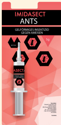
5 Gramm Spritze, verpackt im Blister

für professionelle Anwender verpackt zu 6 Stück im Karton